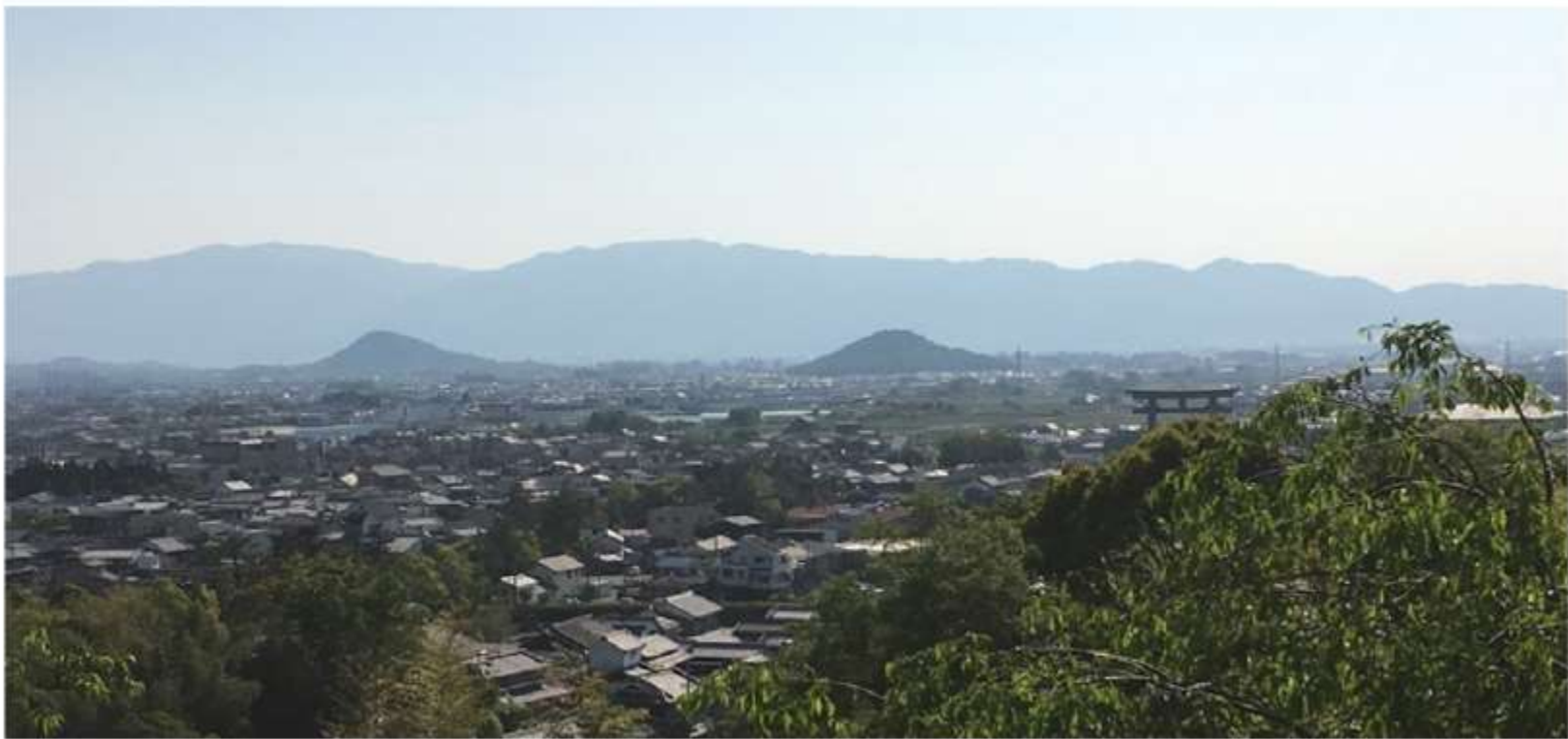
畝傍山・耳成山・三輪神社鳥居